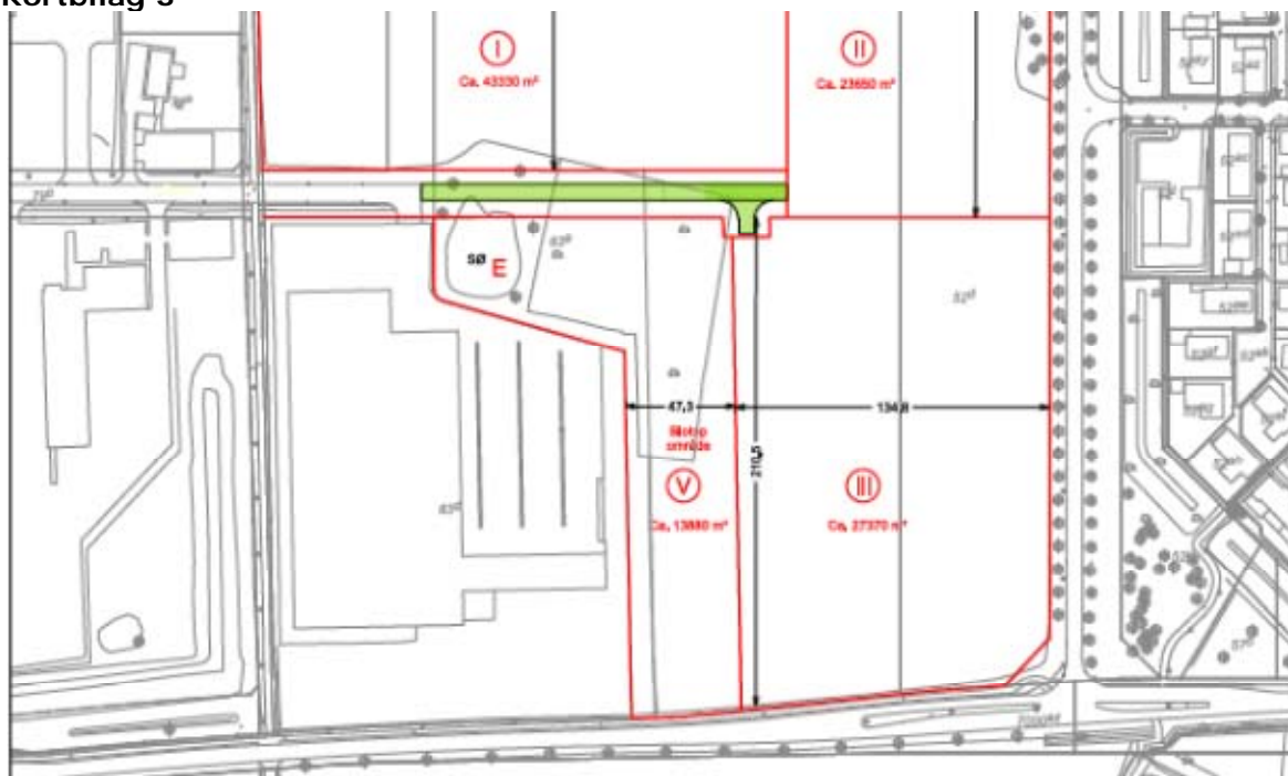
Delområde V på knap 1,4 ha udlægges til naturområde /yngle- og rasteområde