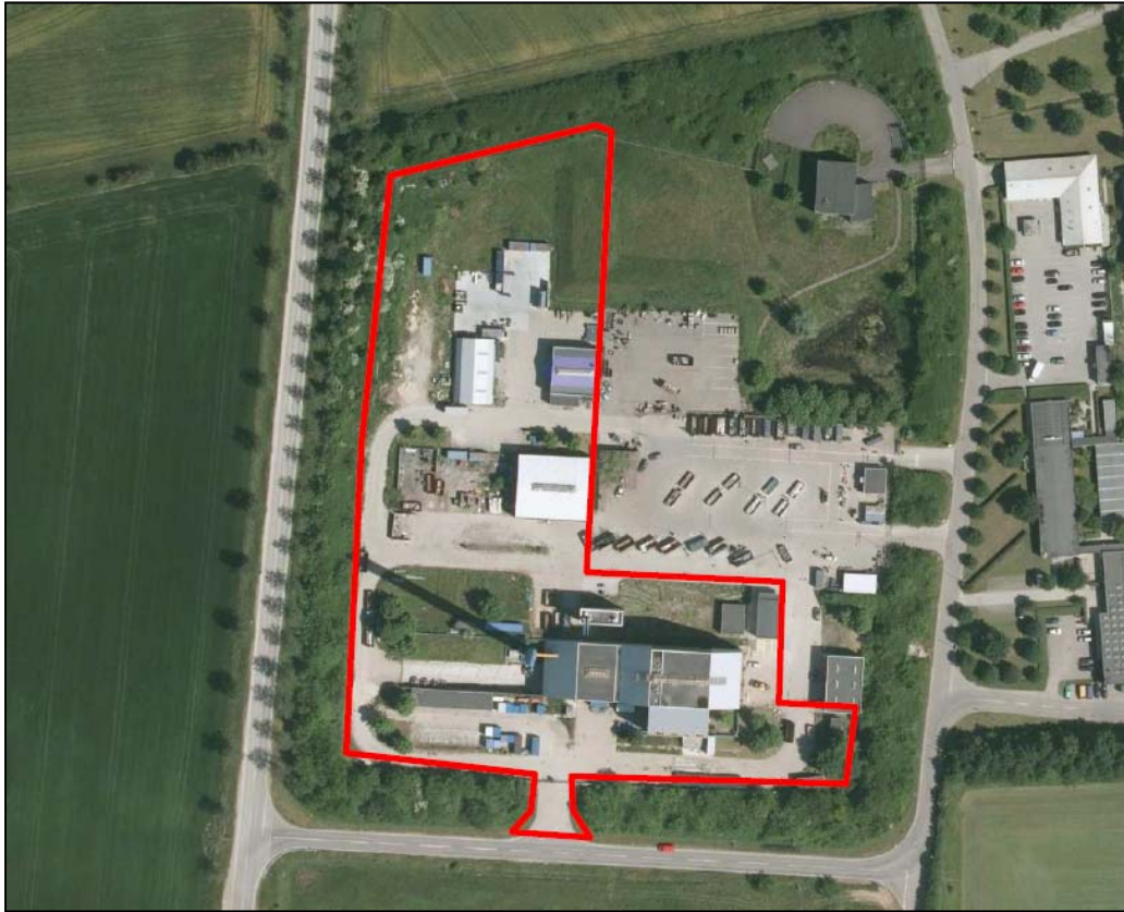
Plantegning over Lervangen 1-3. Projektområdet for ressourcecentret ligger inden for den røde markering.