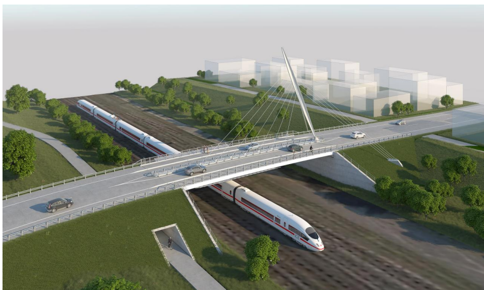
Figur 2 Visualisering af hvorledes broen kan komme til at se ud.

Projektet er omfattet af pkt. 10b og 10e i bilag 2 til lovbekendtgørelse nr. 448 af 10. maj 2017 (Miljøvurderingsloven) og skal derfor screenes for eventuel pligt til at gennemføre en miljøvurdering af det konkrete projekt.