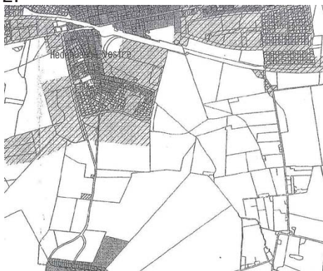
Figur 2. Forsyningsområdet for den kommunale vandforsyning HTK Vand A/S (skraveret område).

I den eksisterende kommunale vandforsyningsplan fra 1999-2003 fremgår det, at den vestlige del af Nærheden er et forsyningsområde for den kommunale vandforsyning. Jf. figur 2.