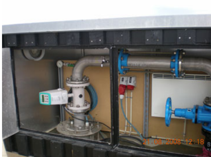
Foto nr. 8. En af Snubbekors Værkets 4 borer.

I 2008 blev Snubbekors Værket sat i drift. Der er etableret fire borer, som skal indvinde op til 1 million m 3 vand til den kommunale vandforsyning HTK Vand A/S. Boringerne er udført med en råvandsstation over jorden.