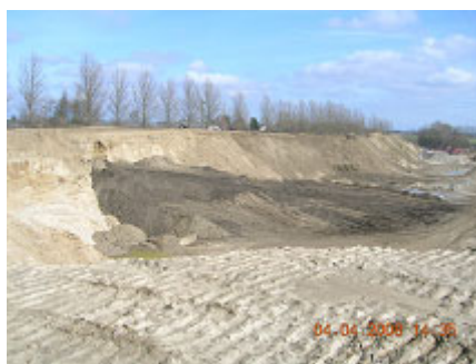
Foto. Nr. 3. Råstofgrav på Kohøjvej 10

Kommunen fører tilsyn med alle aktive råstofgrave efter behov, dog bliver der ført mindst ét tilsyn om året. I 2008 var det nødvendigt at varsle et påbud om at lovliggøre en række ulovlige forhold i grusgraven på Kohøjvej 10, Sengeløse. Der var bl.a. lagt jord uden for graveområdet, og der var gravet for tæt på den gasledning, der løber gennem grusgraven. Efter flere tilsyn og møder med råstofindvinder, blev problemerne løst.