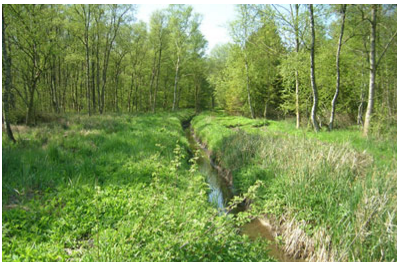
Foto nr. 6. Hove Å

Der er i samarbejde med Roskilde Kommune blevet foretaget opmåling af Hove Å på den fælles strækning samt ind i Roskilde Kommune frem til Gundsømagle Sø. Opmålingen har medført at Hove Å er blevet oprenset på få delstrækninger i Høje-Taastrup Kommune.