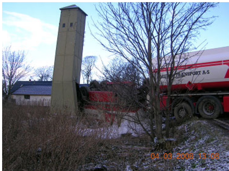
Foto13: Spild på Brandhøjgårdsvej 100

Der har desuden i 2008 været flere mindre spild, hvor kommunen har givet påbud om undersøgelse og oprensning af forureningen. Et spild af hydraulikolie på Høje-Taastrup station har udover sagen på Brandhøjgårdsvej ikke kunne afsluttes i 2008. På Landsbygaden 36 blev der fundet hidtil ukendt forurening i forbindelse med byggeri, og en frivillig oprensning blev iværksat alt i samarbejde med Region Hovedstaden. Sagerne videreføres dermed i 2009. Der har i 2008 været fire sager i forbindelse med forureninger ved villaolietanke. Oprensningen betales typisk af grundejers forsikring, idet kommunen giver påbud om undersøgelse og oprensning og følger denne gennem hele forløbet. En af disse sager skyldes forurening fra en gammel villaolietank, som ikke er dækket af forsikringen, hvorfor det økonomiske udestående mellem køber og sælger skal afgøres ved domstolene. De øvrige tre sager har kunnet afsluttes i år.