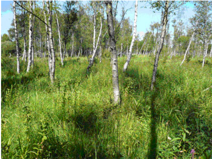
Foto nr. 10. Lysåben birkemose i Sengeløse Mose

Da Porsemosedefredningen som nævnt snart forventes endeligt afgjort, fik kommunen også foretaget en botanisk registrering og en vurdering af plejebehovet i kommunens del af Porsemosen. Porsemosen er en vigtig fuglelokalitet med bl.a. ynglende pungmejser, hvilket gør den til en lokalitet af national betydning. Høje-Taastrup Kommune har i samarbejde med Egedal kommune igen i 2008 fået foretaget en optælling af ynglende fugle i Porsemosen.