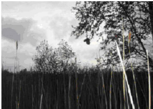
Foto nr. 11. Pungmejsereede i Porsemosen

Da Porsemosedefredningen som nævnt snart forventes endeligt afgjort, fik kommunen også foretaget en botanisk registrering og en vurdering af plejebehovet i kommunens del af Porsemosen. Porsemosen er en vigtig fuglelokalitet med bl.a. ynglende pungmejser, hvilket gør den til en lokalitet af national betydning. Høje-Taastrup Kommune har i samarbejde med Egedal kommune igen i 2008 fået foretaget en optælling af ynglende fugle i Porsemosen.