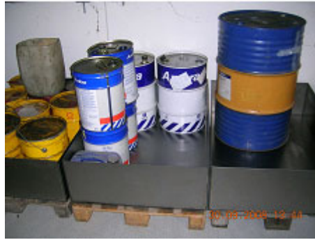
Foto nr. 1. Opbevaring af olier i spildbakker efter reglerne hos Schrøders Metal.

Som følge af en klage over lugt fra en nabo har kommunen ført tilsyn med en virksomhed der foretager adressering, pakning og distribution af tryksager. I forbindelse hermed sker der en varmebehandling af plastfolier. Virksomheden havde orden på affaldssortering og tilsynet fokuserede på at skabe klarhed omkring virksomhedens emissioner.