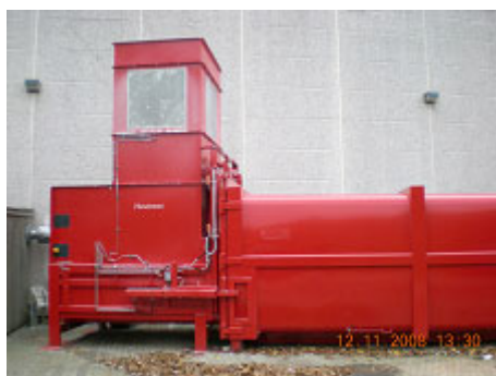
Foto nr. 2. Nyt udsugnings- og komprimeringsanlæg. Anlægget blev støjdamperet, så virksomheden overholder de meddelte støjvilkår.

Kommunen fik en klage over støj fra en virksomhed i Hedehusene, som havde etableret nyt udsugnings- og komprimeringsanlæg. Støj kan være vanskelig at stedfæste. Det viste sig imidlertid at være en virksomhed der tidligere har givet anledning til støjklager.