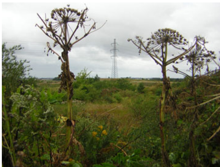
Foto nr. 12. Bestand af kæmpebjørneklo på Kohøjvej

En udryddelse af planten i kommunen forudsætter dog en effektiv bekæmpelse på både private og offentlige arealer på samme tid. Derfor har kommunen i august 2008 vedtaget en indsatsplan for at komme planten til livs.