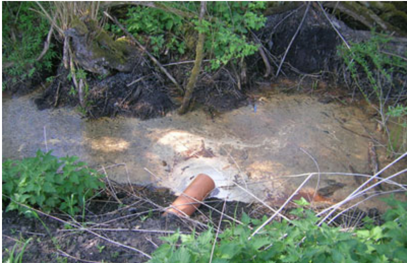
Foto nr. 7. Udledning af husspildevand fra overbelastet bundfældningstank fra ejendom i det åbne land.