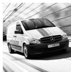
Mercedes-Benz Vito E-Cell