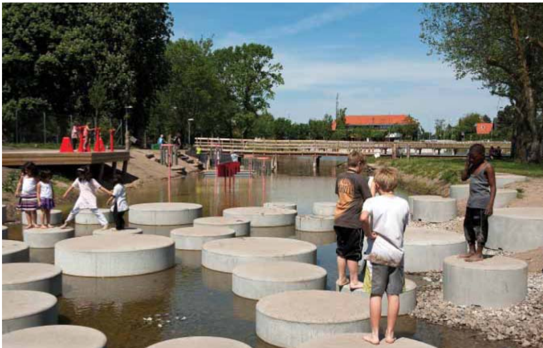
Selmose vand- og aktivitetspark, hvor Høje-Taastrup Kommune kombinerer indsats mod oversvømmelse ifm. store regnvands-hændelser og et rekreativt byrum

Handlingsplanen for klimatilpasning, forventes at foreligge i udkast medio 2014, og skal være et tillæg til den overordnede Kommuneplan (2012-2024).