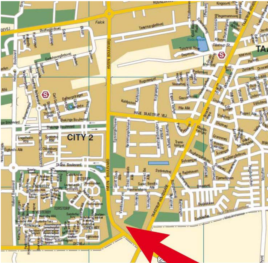
Taastrup Hovedgade 186 A-L