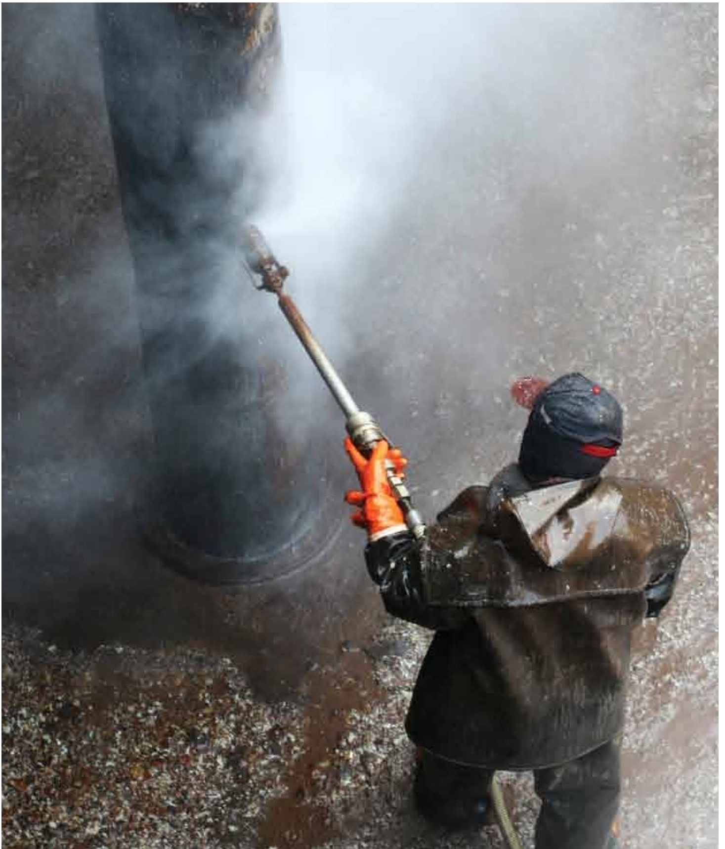
Billede: Mand der er i gang med at vaske stolpe med en højtryksspuler.