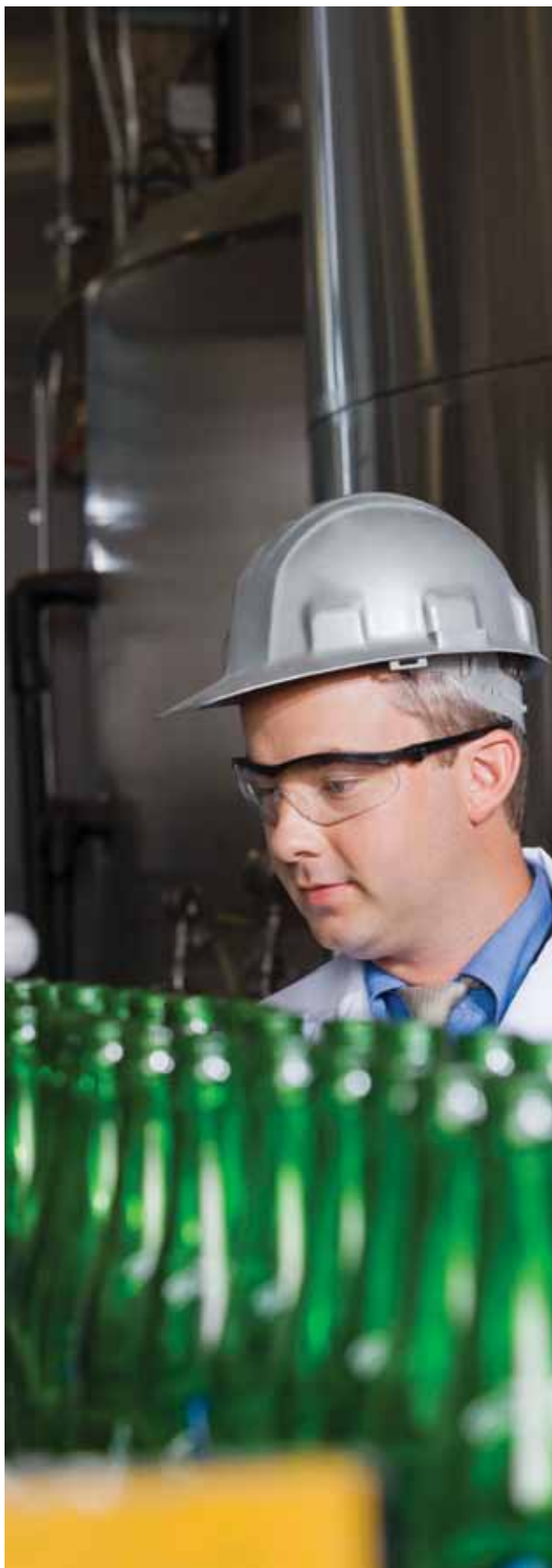
Billede: Mand ved samlebånd der kigger på flasker.