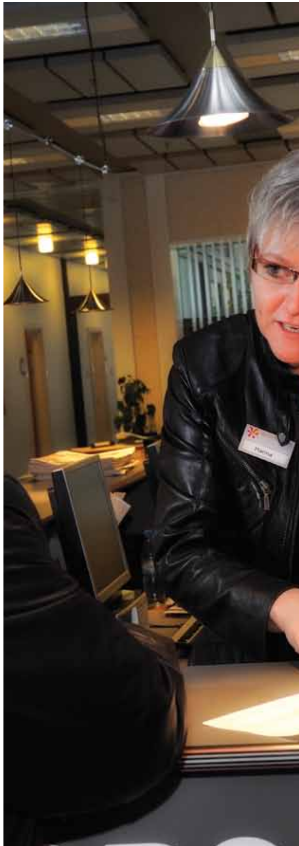
Billede: Dame der bliver rådgivet ved skranke.