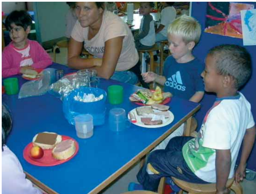
I daginstitutionen Hulen var startskuddet til en madpakke-politik et forældremøde, hvor der blev kørt to rulleborde frem i pausen - et med de gode og et med de dårlige eksempler på madpakker.