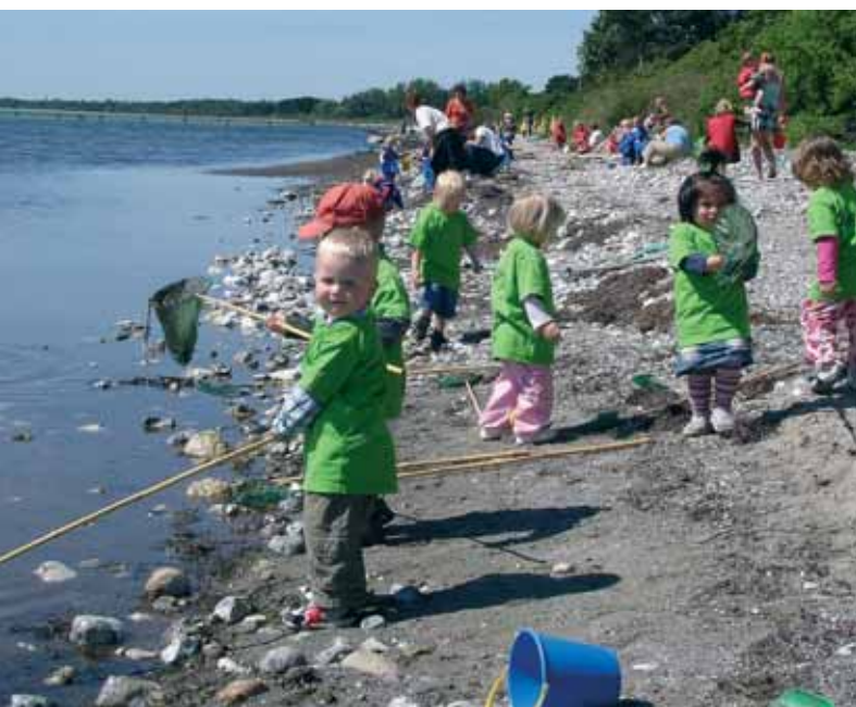
Der er skønt på Hartmannsgaves strand sådan en sommerdag!