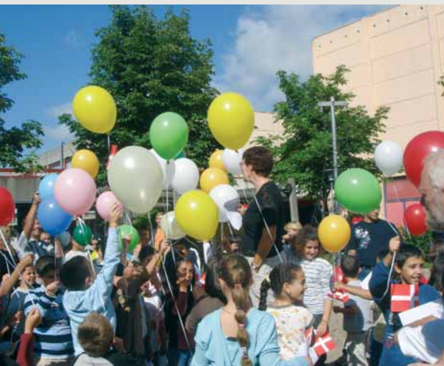
Med flag og balloner i friske kulører blev Selsmoseskolen indviet som helhedsskole på første skoledag.