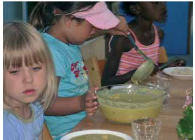
Som nogle af de få nyder børnehavebørnene i Hallandsparken godt af, at forældrene og institutionen har grebet muligheden for at oprette en forældrebetalt madordning.