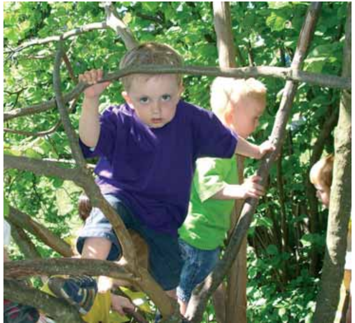
Træklatring giver herlige udfordringer for en mini-Tarzan...

Efter formiddagens aktiviteter var det tid til at spise vores madpakker og få noget at drikke. For de mindste børn var det skønt med en lur i skyggen under træerne, mens de store bl.a. gik til stranden, læste bøger og legede i sandkassen. Eftermiddagene bød på leg og hygge, indtil bussen hentede os kl. 15.30 - dog optrådte vi fredag for hinanden ved at spille på vores hjemmelavede instrumenter, hvortil der blev danset og sunget.